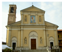
S. Giorgio Martire CORNATE D'ADDA