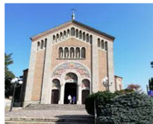
S. Giuseppe PORTO D'ADDA