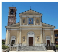
S. Giorgio M.